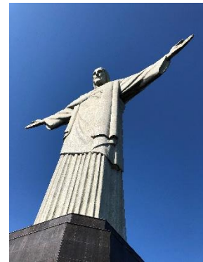
独立100周年を記念して つくられたキリスト像

ペドロ1世は、独立を望む多くのブラジル人の支持を得て、1822年9月7日、ブラジルはポルトガルとの完全離脱を宣言（独立宣言）をし、この日がブラジルの独立記念日となりました。